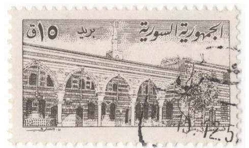
ダマスカス アゼム宮殿の郵便切手